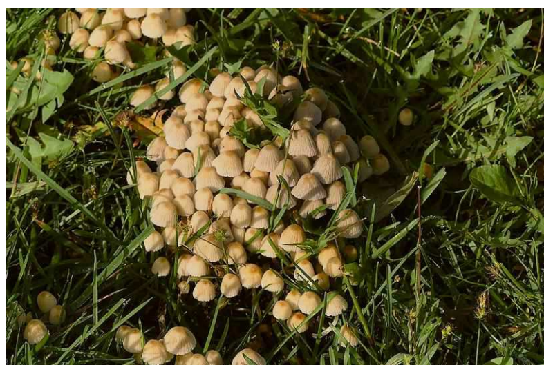
Zwerminktzwammen in het Steenbergerpark. Hero Moorlag

Waar draait het om. Vorig jaar is IVN landelijk begonnen met deze challenge om iedereen in Nederland uit te dagen naar buiten te gaan. Ook als het weer minder wordt. Twee uur natuur in de week is gezond. Alle voordelen om de natuur in te gaan zijn al vaak beschreven en bejubeld. Daar hoef ik niets aan toe te voegen. Tegenwoordig wordt gelukkig vaker gekozen voor een buitenschoolse activiteit in de natuur na schooltijd. Steeds meer kantoren worden groen ingericht en met het dringende advies tot thuiswerken zijn