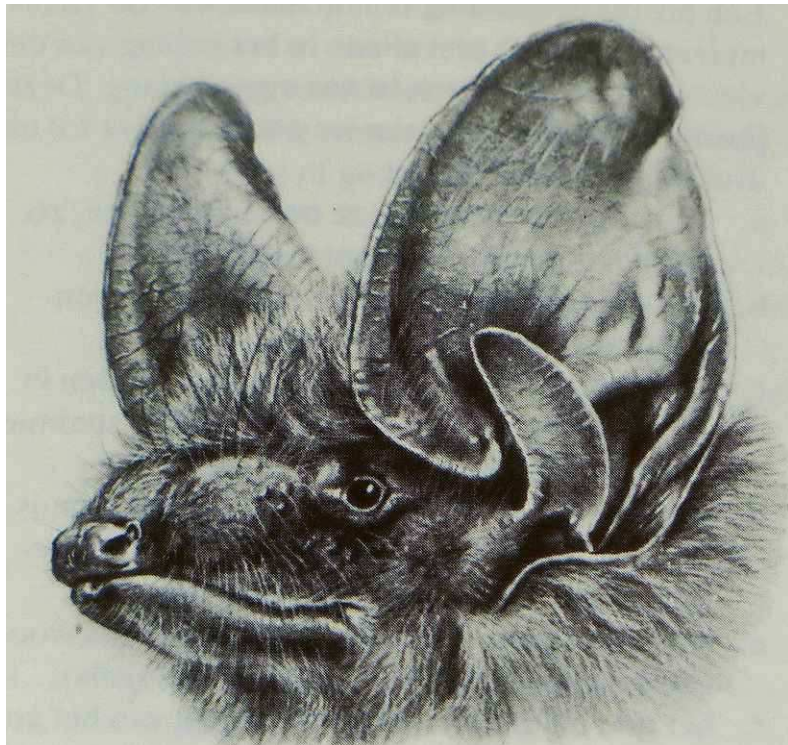
Kop van een laatvlieger. Folder Bescherm onze Vleermuizen