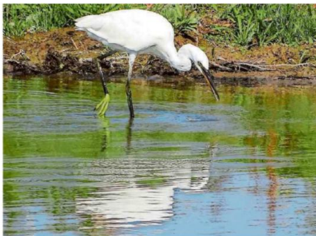
De kleine zilverreiger heeft 'golden slippers'. Albert Kerssies

In de rivierdalen en in moerasgebieden komt naast de grote zilverreiger tevens de kleine zilverreiger voor. Deze kleine zilverreiger komt in veel lagere aantallen voor, maar is eveneens aan een bescheiden opmars bezig. 'The lady with the golden slippers' is een prachtige Engelse benaming voor de kleine zilverreiger. Deze vogel vestigde zich midden jaren negentig van de vorige eeuw in