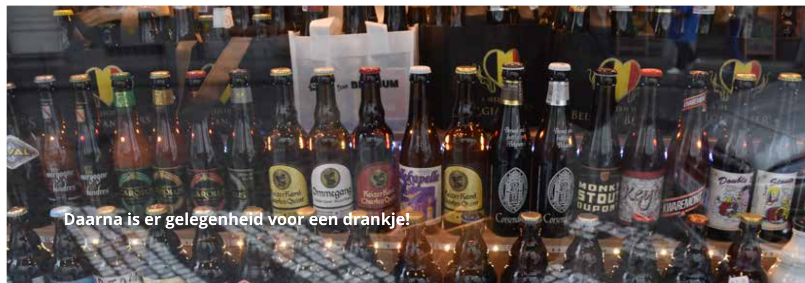
Daarna is er gelegenheid voor een drankje!