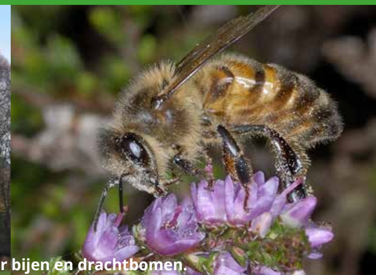
Na de ALV zal Henk Verver iets vertellen over bijen en drachtbomen.