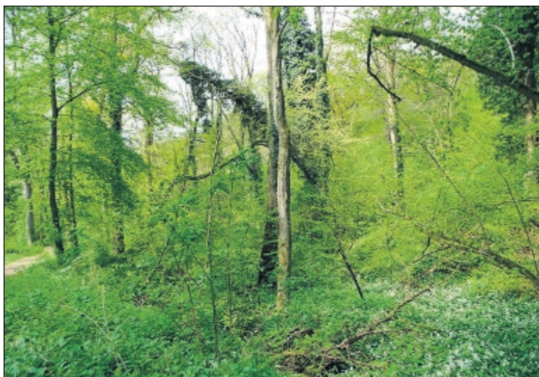
De weelde van een natuurlijk Drents bos.

Natuurlijke bossen kennen we in Nederland en Drenthe vrijwel niet. Wel komen er enkele restanten van oorspronkelijk grotere natuurlijke bossen in Drenthe voor, zoals het Mantingerbos en het Norgerholt, bekende oude bossen. Sinds 2004 behoort het Kremboongbos bij Hoogeveen eveneens tot de natuurlijker bossen. Het werd toen officieel bosreservaat. Het bijzondere is dat de ontwikkeling in tijd en ruimte in 'natuurlijke' bossen steeds meer variatie en een hogere soortenrijkdom oplevert. Het overgrote deel van de Nederlandse en Drentse bossen zijn evenwel aangeplant in het begin van de vorige eeuw op relatief voedselarme heidegronden. Ze hebben daardoor een start op voedselarme bodem gehad, hetgeen ook nu nog steeds te zien is aan de bosstructuur. Het bos bestaat uit naaldbout: den, larix en sparren. Berken en eiken komen sporadisch voor. De boomlaag is weinig gevarieerd en de struik- en kruidlaag is gemiddeld tot zeer matig ontwikkeld. Ook de hoeveelheid dood hout is maar beperkt aanwezig. In een echt natuurlijk bos