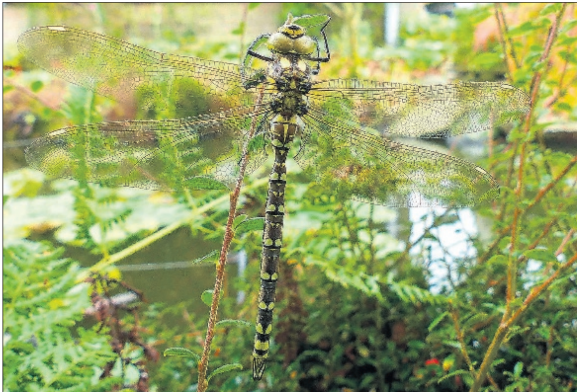
Herfstwaarneming vers uitgeslopen mannetje blauwe glazenmaker.