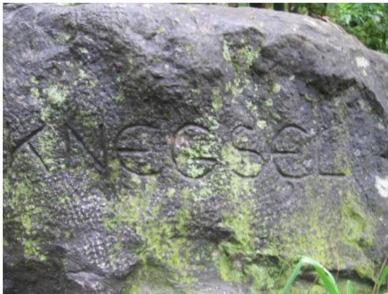
Tekst op de steen