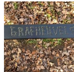
Tekst bij de grafheuvels

Op Veldhovens grondgebied liggen veel grafheuvels. Deze zijn opgeworpen tussen 2000 tot 900 jaar voor Christus. De heuvels zijn nog te zien, omdat ze na een gedegen onderzoek werden gerestaureerd. Uit bodemverkleuring is bekend dat er grafheuvels omringd zijn door één palenkrans of een dubbele palenkrans. Er zijn er ook met een greppelrand. Er ligt zelfs een combinatie, bestaande uit een hoofdheuvel met een bijheuvel. Al deze heuvels zijn onderzocht. Bij een dergelijk onderzoek wordt voorzichtig te werk gegaan, want niet alleen de voorwerpen die gevonden worden, kunnen iets over het verleden vertellen, maar ook uit de verkleuringen van het zand kan veel worden afgeleid. Het is als het lezen van een boek, echter wel een boek dat slechts één keer is door te bladeren. Er zijn o.a. urnen met verbrande botresten gevonden. Daaruit kan het geslacht en ongeveer de leeftijd van de overledene worden geschat en er zijn zelfs methoden om het tijdstip van overlijden te bepalen.