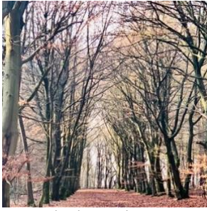
Beukenlaan in de winter