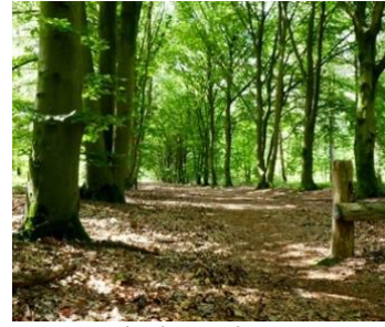
Beukenlaan in de zomer

Een merkwaardige laan: prachtige beuken in een Brabants naaldbos. De grootte van de bomen geeft aan, dat ze er al stonden voordat de omringende naaldbossen werden aangeplant. Waarom er beukenlanen zijn aangelegd in een gebied dat vooral uit heide bestond, is niet bekend. De beuk werd aan weerszijden van oprijlanen geplant. Veel schaduw in de zomer, prachtige bladverkleuring in de herfst. Een droog en stevig wegdek door zijn wortelstelsel, dat gedeeltelijk boven de grond groeit. De boom stelt wel voorwaarden aan de bodem. Die moet leemachtig, vrij voedselrijk en niet te nat zijn. In de Molenvelden is dit het geval.