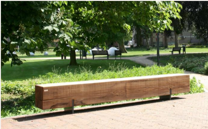
Voorbeeld van zo'n bank

Het asfalt, een restant van de Stipdonkseweg, naast de Nieuwe Aa wordt opgebroken en afgevoerd. De laarzenpaden in het gebied worden in de toekomst tweemaal per jaar gemaaid. Op de locaties met fraai uitzicht komen zitbanken. Gekozen is voor een robuuste bank die past in het landschap.