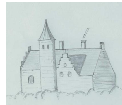
Kasteel Cronesteyn rond 1600

In 1975 kwam Cronesteyn in handen van de gemeente Leiden. In 1982 werd het polderpark gerealiseerd naar het ontwerp van Evert Cornet. Het park is geworden tot ontmoetingsplek, rustpunt, historisch monument en speciaal biotoop.