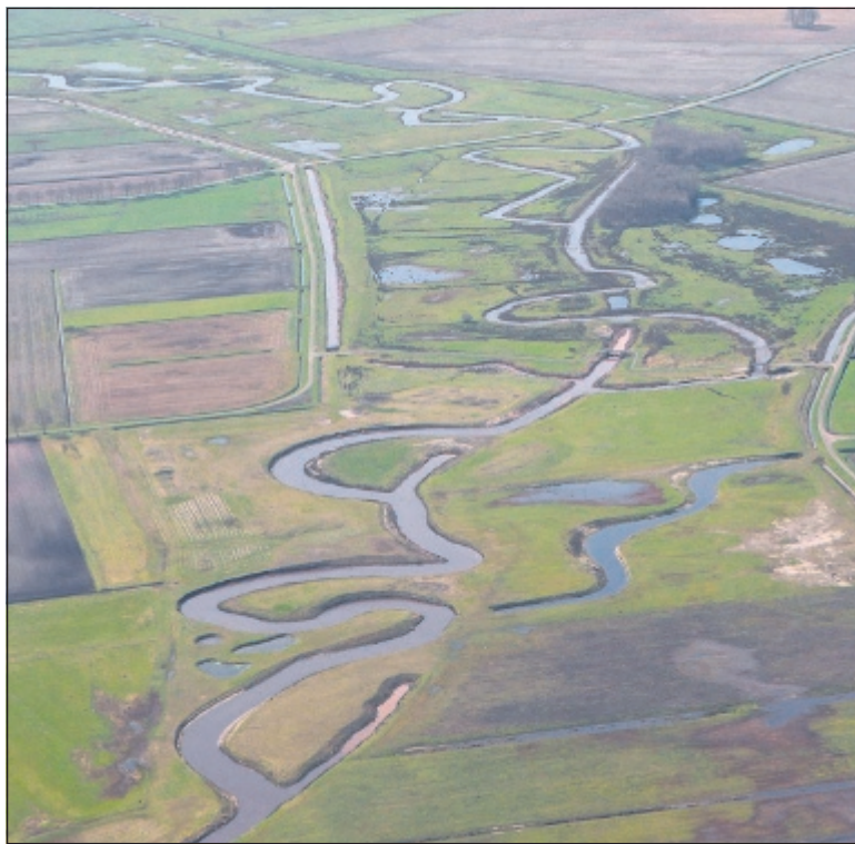
Luchtfoto heringericht Hunzedal bij Bonnerklap.

Beken kennen geen grenzen. Van oorsprong loopt de Hunze via het Zuidlaardermeer door de stad Groningen naar Lau-