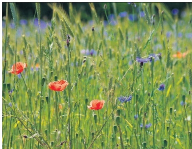
Roggeakker met korenbloem en klapproos.

Na de intrede van de kunstmest, machinaal schonen van zaad, toepassing van drijfmest en het toenemende gebruik van bestrijdingsmiddelen nam de graanproductie per hectare fors toe. Het gevolg was dat de meeste kruiden uit de akkers verdwenen.