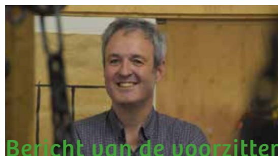
Bericht van de voorzitter

Vanaf € 2,- per maand ben je al lid, meld je aan via de website https://www.ivn.nl/steun-ivn/word-lid