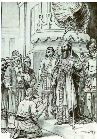
Koning Salomo luistert naar de geknielde arbeider.