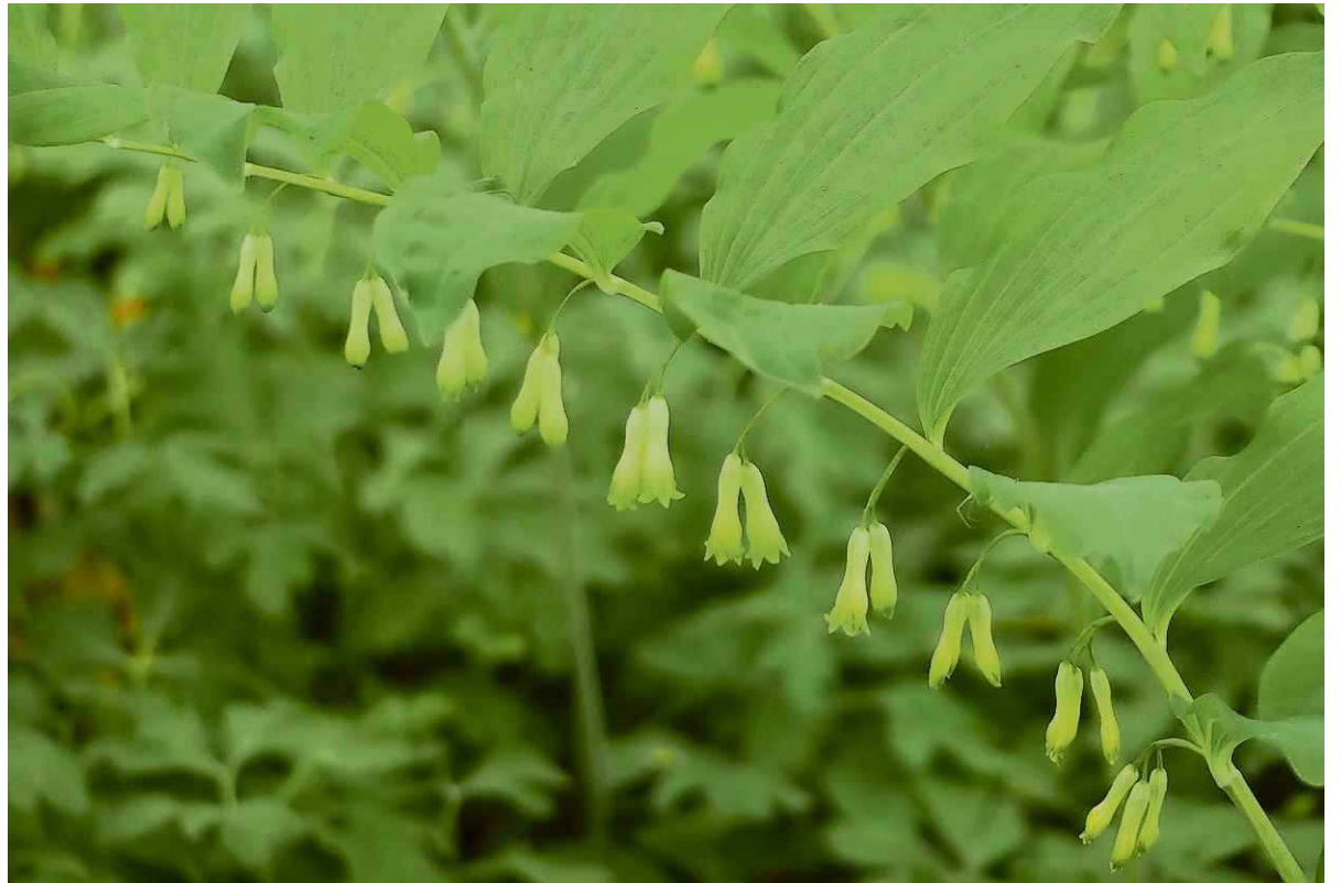
Salomonszegel. Hero Moorlag

Prachtig verhaal. De tekeningen vond ik in het oude leesboekje voor de lagere school "Bosleven" van J. de Jonge, in 1948 uitgegeven door J.B. Wolters, Groningen en Batavia. De tekening van koning Salomo en de knielende arbeider is van Cornelis Jetses. Bij de tekening van de wortelstok staat geen auteur. Je ziet vier "zegels". Het zijn wonden, oude plekken waarop de stengel van Salomonszegel heeft gestaan. De wortelstok groeit steeds door en vormt rechts een nieuwe bloeistengel. Salomonszegel is een mooie naam, ontleend aan een mythe. In Drenthe heet de plant heel anders, namelijk motte-mit-keunen of motte-mit-biggen. Het lijkt of onder de grote bladeren (de zeug) een rij biggen melk drinkt. De magie van deze wilde bosplant is niet verdwenen. Salomonszegel heeft medicinale krachten en wordt zowel inwendig als uitwendig toegepast in een tonicum en in smeermiddeltjes tegen kneuzingen, wondroos, fijt en negenogen. Fijt is een diepe en pijnlijke huidontsteking. Negenogen is een karbonkel of