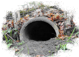
Dassentunnel onder een weg

Door deze wettelijke bescherming, aanleg van faunapassages en inzet van vrijwilligers, gaat het nu beter met de das op de Utrechtse Heuvelrug en leven er meer dan 250 dassen. Nu is de grootste bedreiging voor de das het verkeer. In onze regio worden 20-50 dassen per jaar doodgereden.