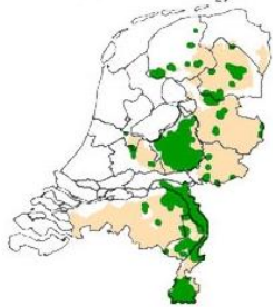
Leefgebied van de das in Nederland met in oranje de situatie in 1900 en in groen de huidige situatie

Rond 1980 echter ging het zeer slecht met de das door vervolging, versnippering van leefgebied en de oprukkende mens. In het hele land leefden er nog maar circa 1200 dassen, terwijl dit er in 1900 nog meer dan 12000 waren. Op de Utrechtse Heuvelrug woonden nog maar een paar dassen.