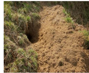
Dassenpijp met breed uitwaaiende storthoop

Voor het graafwerk is de das toegerust met zeer sterk ontwikkelde en gespierde voorpoten. Met zijn stevige achterpoten en achterwerk duwt de das het losgewerkte materiaal naar buiten. Zo ontstaan de opvallende stortbergen bij de uitgangen van de burcht. Kenmerkend zijn de afvoergeulen, die vanuit de uitgang van de burcht naar het eind van de stortbergen leiden.