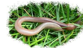
Regenwormen zijn het hoofdvoedsel van de das

Dassens zijn alleseters. Ze zijn slechte jagers en eten dat wat ze direct voor de neus tegenkomen. Door hun luidruchtige manier van foerageren ontsnapt vrijwel alles wat alert is. Ze eten daarom voornamelijk regenwormen die ze 's nachts in weilanden en open gebieden opsporen. Verder eten ze bosvruchten,