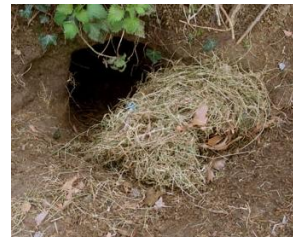
Nestmateriaal voor een dassenpijp

Ook houden ze meerdere keren per jaar een grote schoonmaak in hun holenstelsel. De holen worden dan uitgegraven en het nestmateriaal ververst. Er liggen nooit etensresten in het hol van een das.