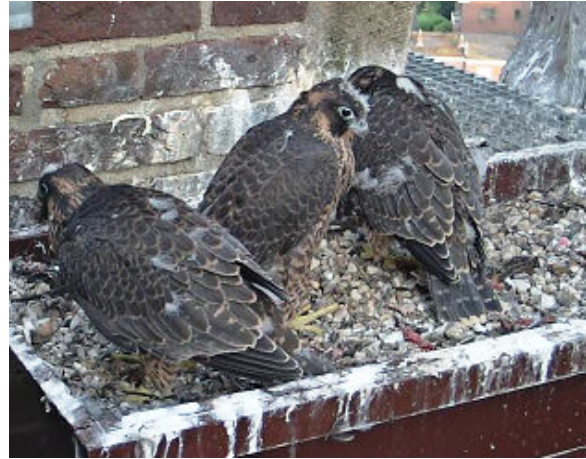
Na een weekje vakantie zie je dit . Het vliegvlugge nabij op 26 mei en dons weg