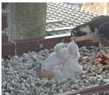
21 april 3 kuikens