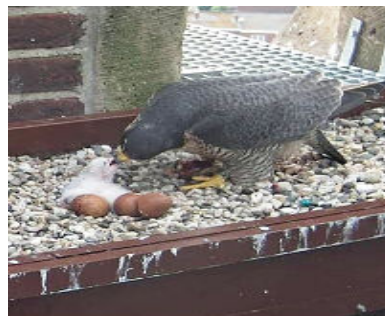
Snel het eerste voer