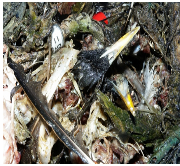
Wat een zootje die prooiresten, als je er naar kijkt kun je het bijna ruiken. Ben wel benieuwd naar de onderzoeksresultaten als die komen.