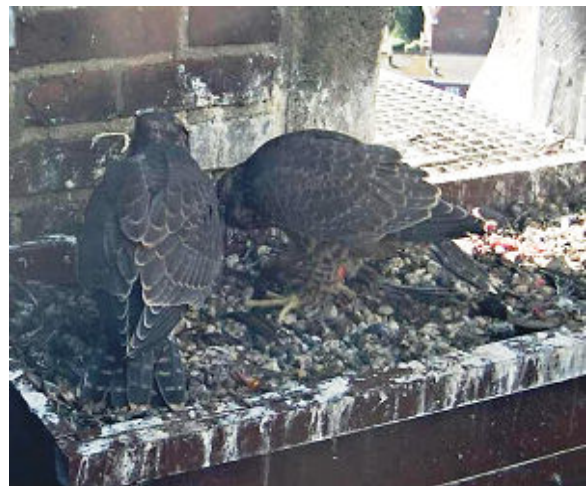
30 mei het uitvliegen nabij