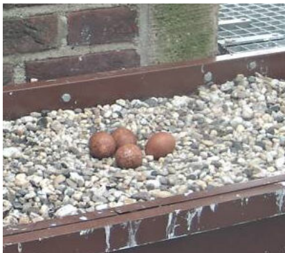
Het legsel is compleet

Dit verhaal omtrent het ringen is tot stand gekomen via de informatie en de foto's die Henny Martens mij aangeleverd heeft, waarvoor mijn dank en de andere foto's heb ik verzameld via de mogelijkheid die de webcam biedt en dat geeft een inzicht in het valkenleven van uitkomen tot het ringen, dus mijn eigen waarnemingen. Maar nu eerst de eieren want 12 maart was er het eerste ei en het broeden kon beginnen en 17 maart was het legsel van 4 eieren compleet . Opvallend was een vrij nerveus broedgedrag waarbij het broedende vrouwtje doorlopend naar boven aan het kijken was. Omdat ik niets van dat gedrag begreep en de slechtvalken in "Beleef de lente " veel rustiger waren ben ik ter plaatse gaan kijken om vast te stellen dat de broedende valk zijn partner kon zien zitten op de liggers van het kruis op de toren en vermoedelijk hielden zij ook dan via geluiden contact. Goede vrijdag 19 april zijn de eerste twee kuikens uit en in de nacht naar 1 e Paasdag is ook het derde kuiken uitgekomen. Zeer opvallend vond ik dat de vierde dag al een kuiken door de grindbak naar de tweede oudervogel liep om te bedelen voor voer.