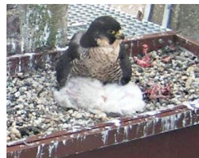
Te groot voor moeder