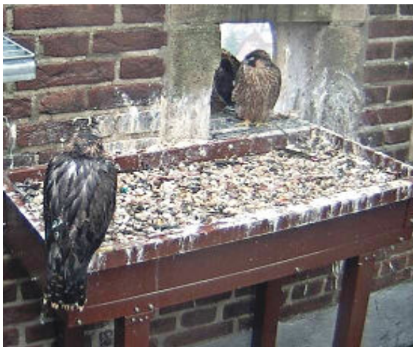
27 mei totaal verregend, ergerlijk.