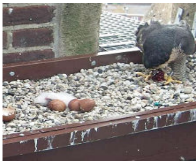
19 april het 1 e kuiken