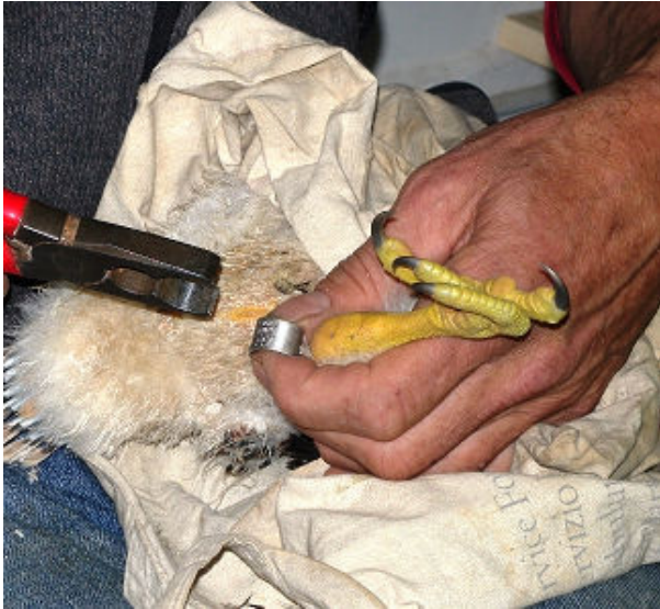
Het ringen is op zich vrij eenvoudig