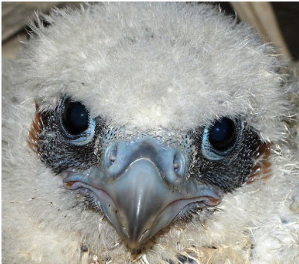
Zo jong en al een vervaarlijke blik