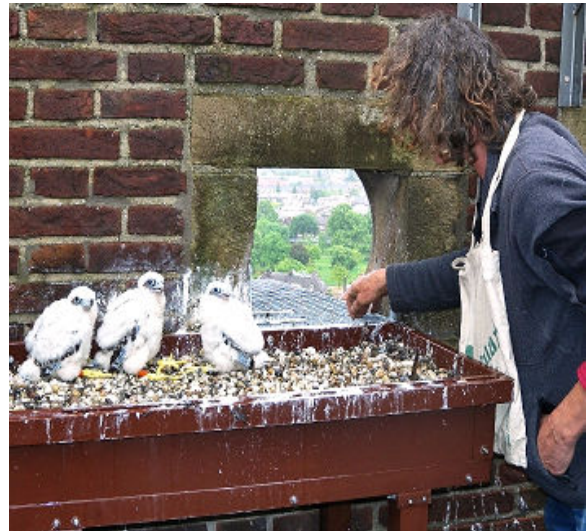
Mooi geringd terug in de nestbak