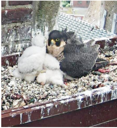
Het past niet onder mam