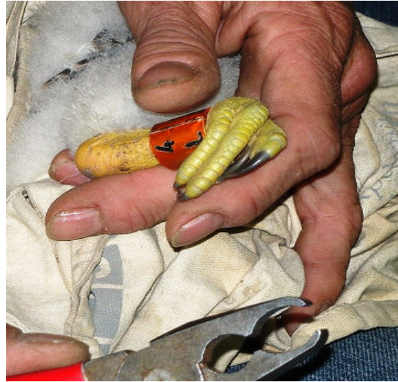
Keurig zoals de ring er om zit