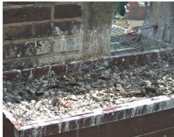
2 juni de valkjes zijn weg en zie wat op straat en in de nestbak achterblijft

Al met al weer een mooi resultaat in 2014 voor het slechtvalkenpaar op de Martinustoren in Venlo. We gaan er van uit dat we dit koppel het volgend jaar zullen weerzien en dat dezelfde webcam weer dienst mag doen, want om een leuke reportage te maken is het wel nodig om foto's te kunnen nemen vanaf de cam. Tenslotte is de toren gesloten en ook te hoog om steeds weer te beklimmen voor een reportage. Werkgroep succes met de schoonmaak van de kast en omgeving en tot het volgend jaar dan maar weer.