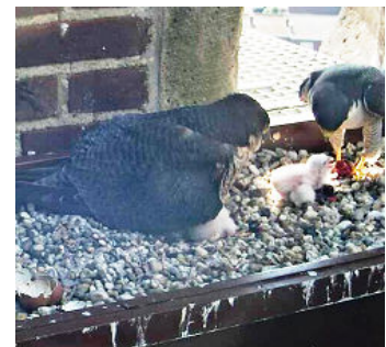
4 e dag, jong volgt ouder