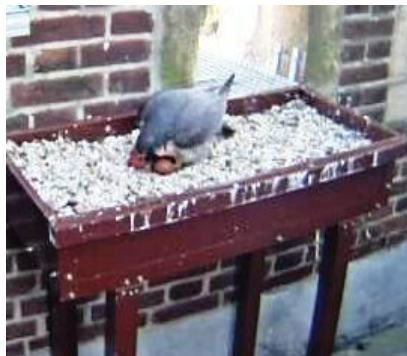
Het broeden is begonnen