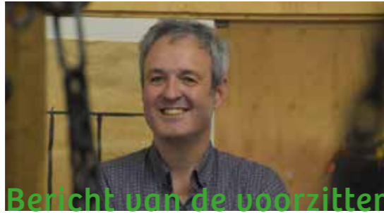
Bericht van de voorzitter

Vanaf € 2,- per maand ben je al lid, meld je aan via de website https://www.ivn.nl/steun-ivn/word-lid