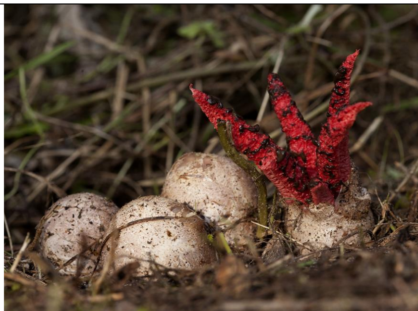
Inkviszwam, De Brand- Stan v Dongen