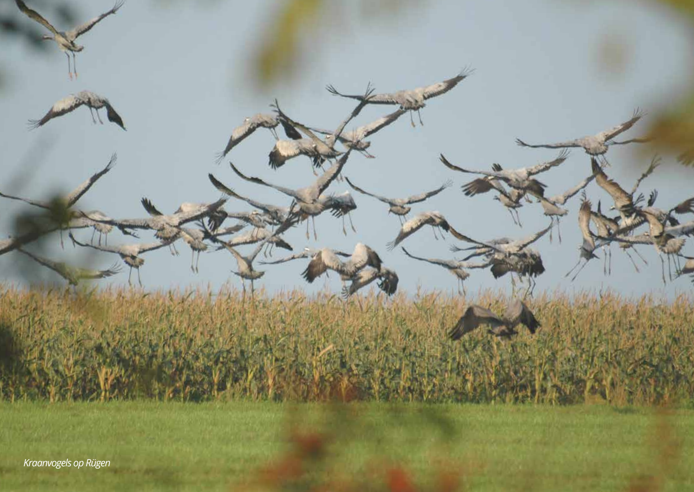
Kraanvogels op Rügen