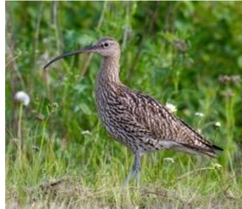
Wulp