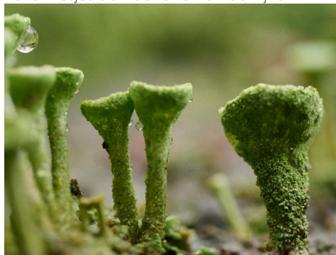
Bekermosjes aan de rand van de vijver

In de kerstvakantie heb ik een inspiratiecursus gevolgd van natuurfotografie.nl. Met het natte en grijze weer erop uit te gaan was een uitdaging.