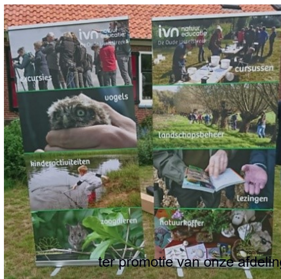
ter promotie van onze afdeling.