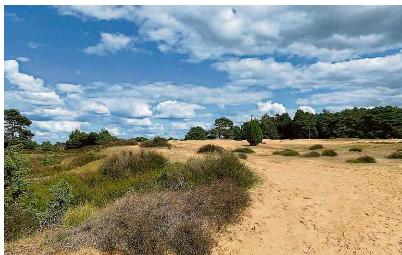
Drouwenerzand, uitermate geschikt voor een wandeling.

De gezonde effecten van groen worden steeds beter aangetoond en onderbouwd. Uit onderzoek blijkt dat mensen zich door meer groen in hun omgeving mentaal en fysiek beter voelen. Juist in de tijd waarin we nu leven is een goede mentale en fysieke condi-