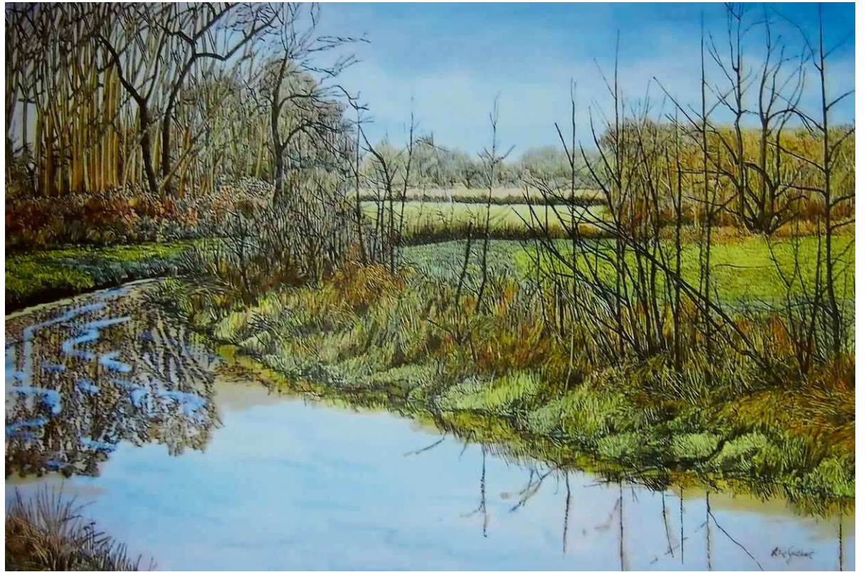
Oude Diep bij Stuifzand. Uit: Drenthe inspireert, 2014.