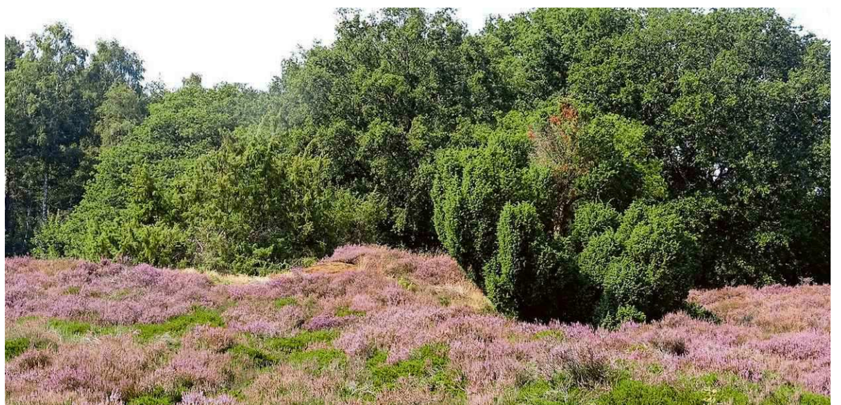
Bloeiende heide in het Terhorsterzand. Albert Kerssies

De heidevelden zijn deze eeuw steeds eentoniger geworden qua bloeiende planten. De verdroging, vermesting en verzuring hebben geleid tot een sterke afname van de diversiteit aan planten. En mede daardoor is er ook