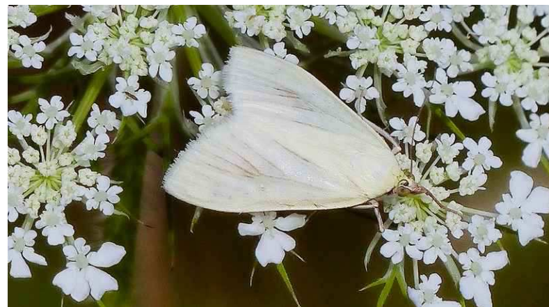
Bruidsmot. Hero Moorlag