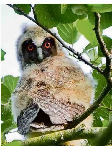
Jonge ransuil.