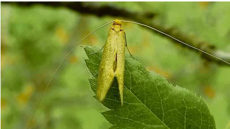
Brede langsprietmot. Hero Moorlag