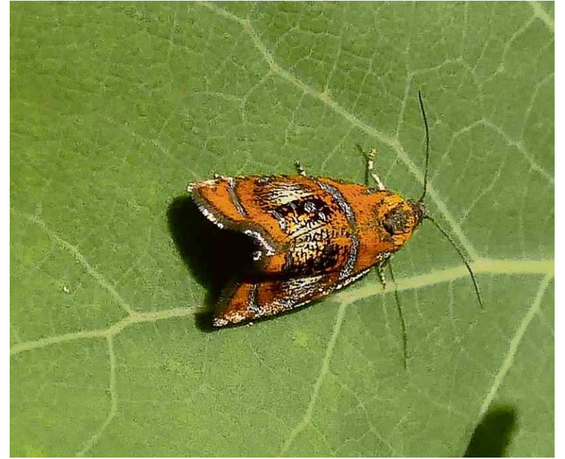
Geisha. Hero Moorlag

Je loopt door hoog gras of door de heide en links en rechts vliegen tientallen grasmotten, groene eikenbladrollers en langsprietmot-