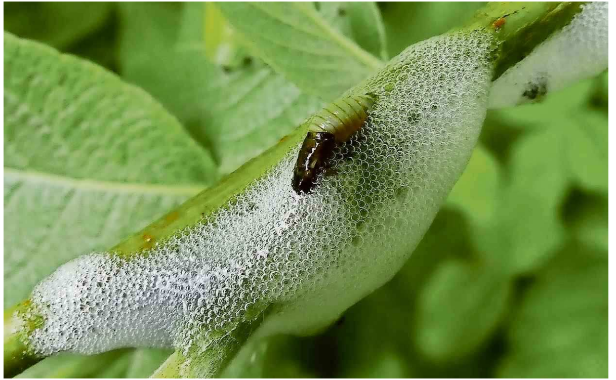
Schuimcicade zichtbaar gemaakt. Hero Moorlag

Er zijn weinig mensen die het geluid van een koekoeksvrouwtje kennen. Ze roept niet koekoek, zoals het mannetje, maar maakt een geluid alsof ze wil gaan spugen. In mei zie je de eerste schuimfluiten op wilgen. Dan is de koekoek ook uit het zuiden gearriveerd. Het vrouwtje heeft blijkbaar in de wilg gezeten en op de takken gespuugd. Koekoeksspog, zei men vroeger. Het schuim is echter niet gespuugd, maar gepoept door de schuimcicade. De nimf boort met zijn zuignuut een gaatje in een wilgentak tot in de "slagader" van de boom waarin water en voedingsstoffen zitten. Hij zuigt zich vol en poept een zoetige stof uit waarin veel vocht zit en een beetje