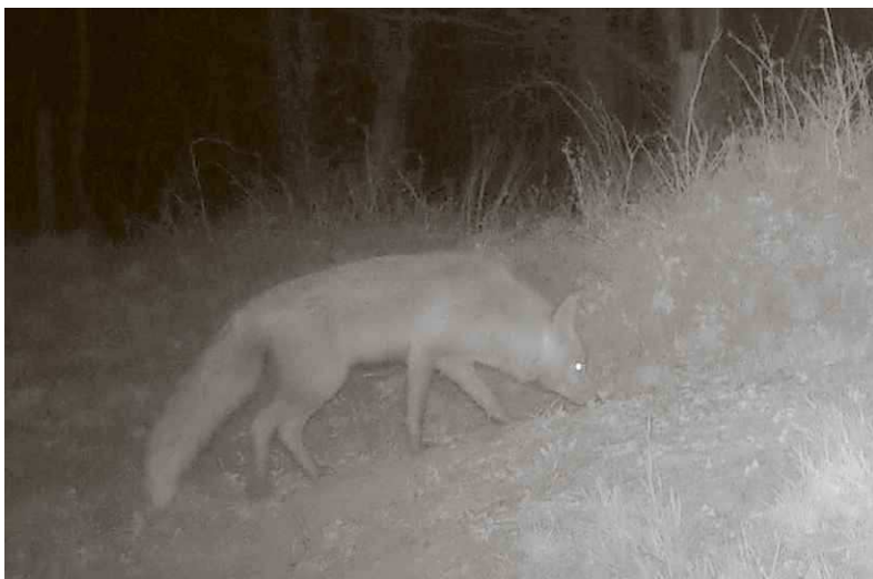
Struinende vos, vastgelegd met infrarood camera. Hero Moorlag