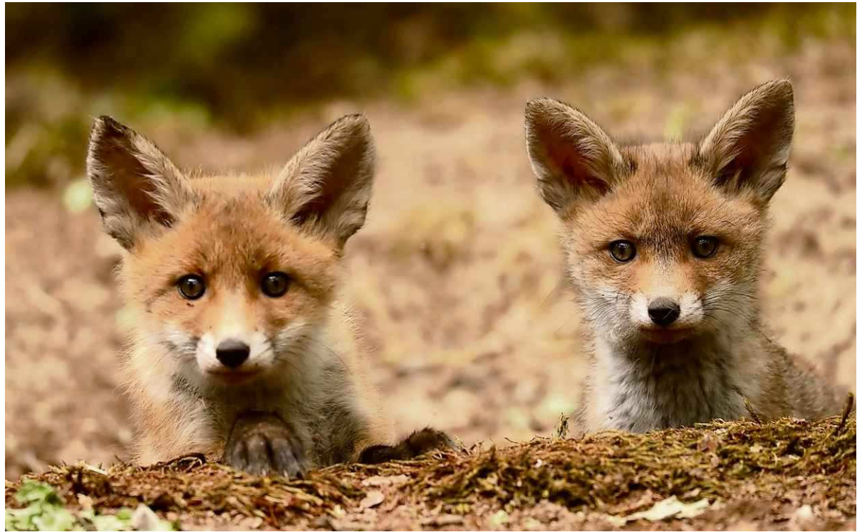
Twee nieuwsgierige vossenwelpen. Frits Kruizinga

Alleen de jachthouder heeft het (voor)recht om in het veld met een geweer te lopen, dieren te doden en die zich toe te eigenen. In de artikelen 3.20 tot en met 3.22 noemt de Wet Natuurbescherming de wildsoorten die mogen worden bejaagd, de plichten van de jachthouder, de middelen die zijn toegestaan, opening en sluiting van het jachtseizoen en de dagen waarop niet mag worden gejaagd. Handhaving gebeurt door Buitengewone Opsporingsambtenaren