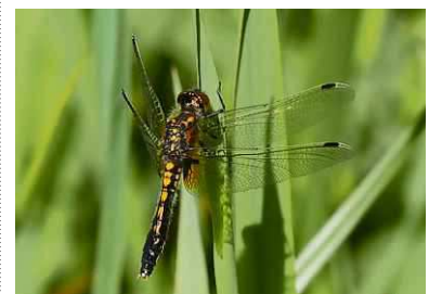
Vrouwtje sierlijke witsnuit. Hero Moorlag

Kiersche Wijde is een uitloper van Nationaal Park Weerribben-Wieden ten noorden van buurtschap Doosje aan de Zomerdijk. Op de beide wandelroutes door dit laagveengebied tref je een keur aan libellen. Op het moment vliegen er drie soorten witsnuitlibellen, waaronder de zeer zeldzame sierlijke witsnuitlibel. De mannetjes vind je zonnend op plompebladeren. De vrouwtjes zonnen in de struiken. De gevlekte en de Noordse witsnuitlibel komen hier ook voor.