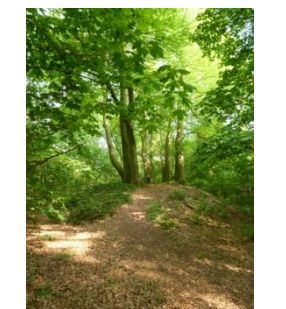
12 apostelen of Heksenheuvel