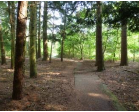
Pad langs larixen