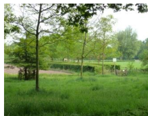
Zicht op Lievendaal