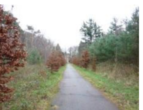
Zichtlijn naar het zorg hotel