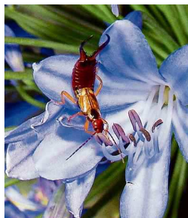
Een oorworm kabbelt aan helmknoppen. Joop Verburg

Oorwormen zijn diertjes waar mensen vaak bang voor zijn. De komt denk ik vooral door de naam die ze hebben gekregen. Die naam is om twee redenen onjuist. In de eerste plaats is het geen worm en in de tweede plaats heeft hij bijzonder weinig in een oor te zoeken. Het diertje zoekt weliswaar een vochtig plekje, omdat hij snel uitdroogt, maar hij zal daar uiterst zelden een oor voor uitkiezen. De tweede reden waarom mensen oorwormen een beetje griezelig vinden, is de tang aan hun achterlijf. Ze worden in Drenthe dan ook Knieptange genoemd. Maar ook dat is niet iets om bang voor te zijn. Ze kunnen er een beetje mee knippen, maar beslist niet door de menselijke huid heen en vormen dus geen enkel gevaar. Hoewel er in de wereld wel een paar duizend soorten oorwormen zijn (die overigens allemaal veel