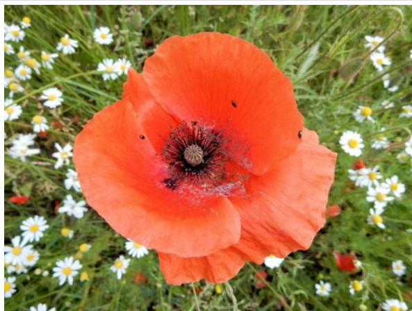
Inheemse Grote klaproos

Regelmatig bieden wij inheems bloemenzaad aan. Gekozen wordt dan voor mengsels voor alle grondsoorten die in de gemeente voorkomen. Als er zo'n actie is dan kondigen we die aan op deze website. U ziet dan een document bestellen en prijslijst bloemzaden . Hou onze website daarom in de gaten.