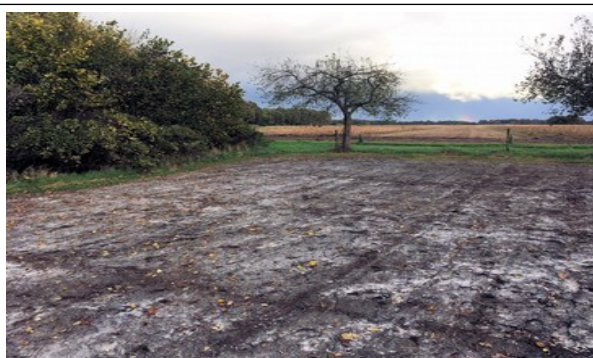
Voor het inzaaien