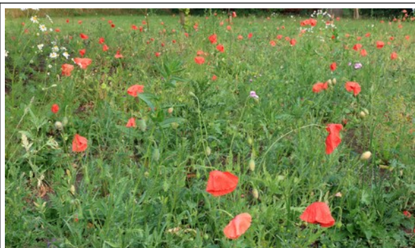
Na het inzaaien (eerste jaar)