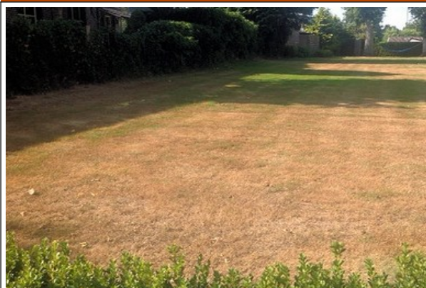
Zinloos gras geteisterd door de droogte

Gras kan heel nuttig zijn. Bijvoorbeeld als veevoer, voor sportvelden en golfbanen en als speelweide voor kinderen. Gras als gazon heeft maar een beperkte waarde, zeker voor de natuur. Regelmatig maaien is meestal de enige activiteit die hier plaatsvindt. Insecten hebben er weinig tot niets aan. Behalve als er hier en daar een paardenbloem de kop opsteekt. Maar meestal is de grasmaaier dan niet ver weg. "Ontgrassen" en "verbloemen" van veel tuinen komt ten goede aan de biodiversiteit en is in ons aller belang. Daarnaast is het ook nog eens gedurende een groot deel van het jaar prachtig om te zien.