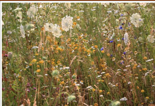
In 2018 ingezaaide bloemenweide(foto juli 2019)