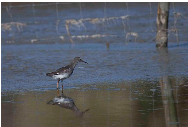
Zwarte ruiters, of toch .....

Het aantal vogelsoorten dat we zagen liep al vlot op. Heerlijk was de discussie: is het nou een zwarte ruiters (deels in winterkleed) of een tureluur? Ook de lepelaar kon aan de lijst worden toegevoegd.