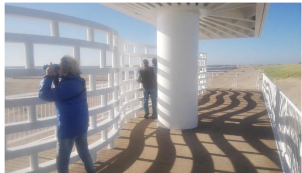
Prins Hendrik zanddijk

Qua vogels viel het wat tegen hier, dus verder maar. Ottersaat was de volgende locatie. Verder naar het noorden rijdend zagen we Dijkmanshuizen en stopten we bij Wagejot (hier waren o.a. een grote groep goudplevieren te zien, enkele bonte strandlopers en een aantal kluten), Krassekeet en De Schorren/Utopia.