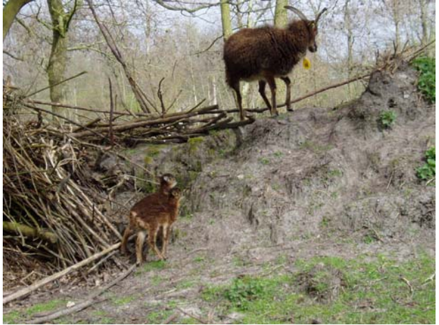
Soaylammeren met moeder

De wind is nog frisjes, maar het is zonnig. De eerste wilde planten staan in bloei. De gulden sleutelbloem, de voorjaarshelmbloem en de kievitsbloem