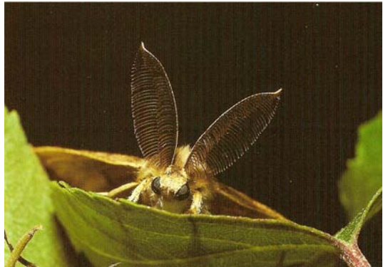
De voelsprietten van de Plakker (mannetje)

De voelsprietten van vlinders zijn voorzien van reukzintuigen, waarvan het aantal groter is naarmate de sprietten groter en sterker zijn geveerd. Hierdoor wordt reukvermogen van de vlinder naar verhouding enorm vergroot. Dit is een eigenschap die vooral bij zoeken naar een geslachtspartner belangrijk is. De Plakker is zo'n vlinder, waarbij het mannetje sterk geveerde voelsprietten heeft om het vrouwtje, dat niet kan vliegen, toch te vinden.