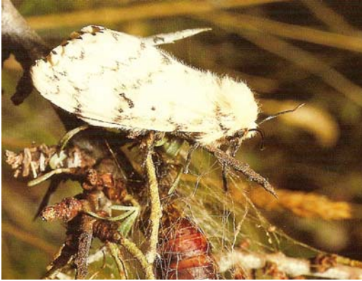
Vrouwtje, met witte grondkleur

De Vlinder vliegt van half juli tot half oktober. De spanwijdte bedraagt tussen de 32 en 55 millimeter. Het mannetje van de vlinder vliegt overdag en 's avonds, het vrouwtje vliegt niet en blijft bij haar cocon. Ze heeft geen monddelen en eet dus niet. De lichter gekleurde vrouwtjes zijn een stuk groter dan de mannetjes.