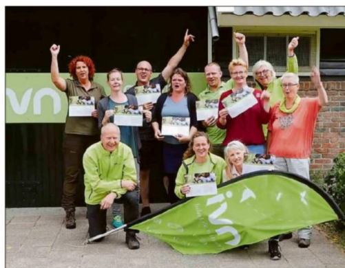
De negen geslaagde Jeugdbegeleiders en hun docenten.

Natuurouders en Jeugdbegeleiders leren tijdens de cursus om een activiteit op te zetten en uit te voeren. Alle facetten worden besproken. Wat we in het begin heb-