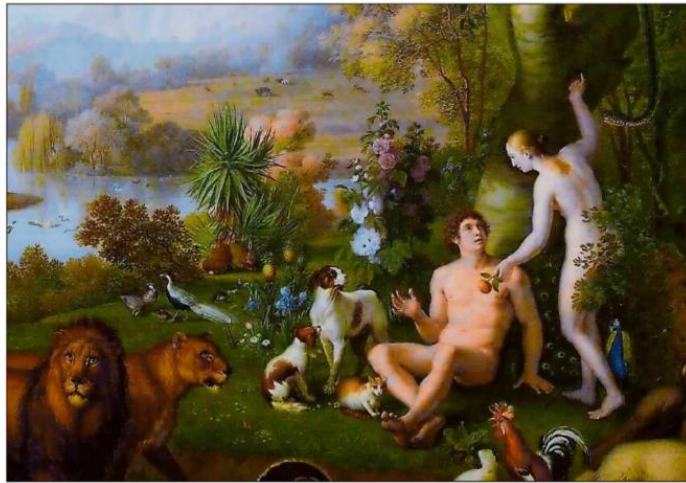
Detail van het schilderij 'Paradijs' uit 1745 in het Vaticaan Museum.

Zijn we van oorsprong vegetarier? Je zou het zeggen als je Adam en Eva in het Paradijs ziet. Ze aten vruchten en waarschijnlijk knollen. Dieren werden niet gedood. De natuur had slechts één gezicht: goede natuur. Volgens het boek Genesis is de Bijbel veranderde dat na de zondeval. Er werden wél dieren gedood, om te offeren en om te eten. De natuur kreeg twee gezichten: goede natuur en vijandige natuur. De mens moest zich wapenen tegen wilde dieren als leeuw, tijger, beer en wolf. Wilder-