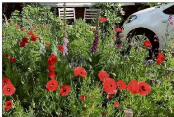
Klaprozen en vingerhoedskruid in mijn voortuintje.

Eigenlijk heb ik maar een ienienie tuintje voor het huis. Niet keurig aangeharkt, voor een hark is geen ruimte. Ook niet voor een schoffel, want alles wat er groeit mag er zijn en als ik het te veel vind, heb ik een paar handen aan het lijf die kunnen wieden. Je weet eigenlijk niet wat onkruid is en wat geen onkruid is, zei iemand ooit tegen mij. Het deed een beetje pijn aan mijn groene hart. Dat niet iedereen van mijn manier van tuintieren houdt, kan ik snappen, maar om nu wat meewarig naar mijn tuintje te kijken en dan zeggen dat je het verschil bijna niet ziet tussen onkruid en dat wat voor een 'gewone' plant kan doorgaan, dat gaat mij te ver. Ik keek met hem mee en kwam tot de conclusie dat het wel meeviel. 'Hier kun je lekkere pesto van maken', zei ik en greep wat vers zevenblad uit de tuin. De ogen werden iets groter er verscheen een zuinig lachje. Het ontlokte een opmerking: 'Ja, dat zal!'