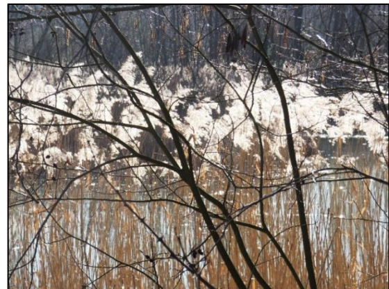
Rietpluimen bij het ven

Er waren 200 soorten mossen (in het verleden), door dichtgroei van kleiputten is dit verminderd. Ook knoflookpad, gewone bruine pad en zandhagedis komen er voor.