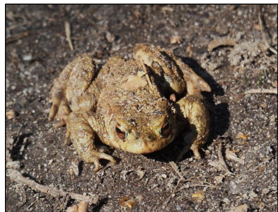
Gewone bruine pad