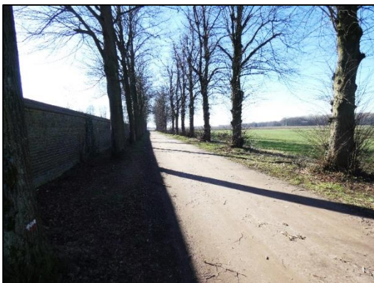
Dubbele rij lindes

De stichter van de Emmaus-beweging is een Franse priester met de naam L'Abbé Pierre. Deze heeft tot doel om armen en daklozen te helpen. Zijn pseudoniem stamt uit de Tweede Wereldoorlog toen hij in het verzet zat.