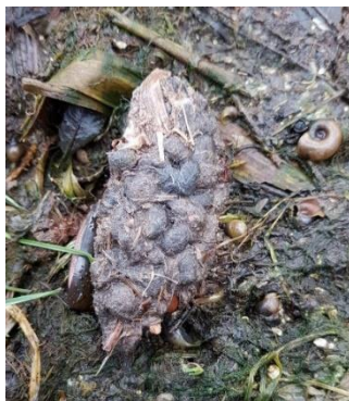
Uitwerpselen van een vos

Een eindje verder op uitwerpselen van een vos, vaak herkenbaar aan de inhoud (kleine vruchtjes) en de kenmerkende eindpunt. Ook braakballen van een buizend zijn we tegengekomen. Bij een meidoorn waar veel vruchtjes op de grond lagen vonden we veel muizen-in- en uitgangen. Onze weg vervolgend zagen we in een wilg een uilekast, waarvan de aanvliegroute