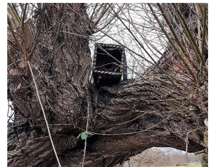
Uilekast met belemmerde aanvliegroute

Een eindje verder op uitwerpselen van een vos, vaak herkenbaar aan de inhoud (kleine vruchtjes) en de kenmerkende eindpunt. Ook braakballen van een buizend zijn we tegengekomen. Bij een meidoorn waar veel vruchtjes op de grond lagen vonden we veel muizen-in- en uitgangen. Onze weg vervolgend zagen we in een wilg een uilekast, waarvan de aanvliegroute