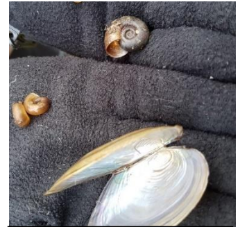
Posthoornslak en Zoetwatermossel

Bij het eerste houten klaphekje zijn we het natuurgebied ingegaan en zijn een tijdje langs de Caumerbeek opgelopen die recent is schoongemaakt. Tussen het uit de beek verwijderde plantmateriaal kwamen we op de oever veel posthoornslakken en een zoetwatermossel tegen.