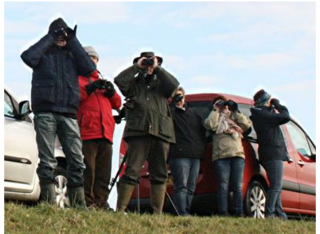
Deelnemers aan nieuwe vogelcursus zien ze vliegen op de Bemmelsedijk.