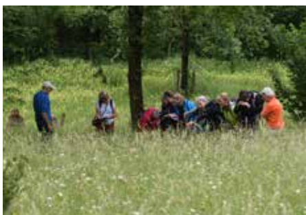
Een fantastisch weekend in Zuid-Limburg, goed georganiseerd, met mooi weer en een mooie excursie in de orchideeëntuin in het Geredal, een landschapswandeling, lekker eten en een excursie in de St. Pietersberg groeve.