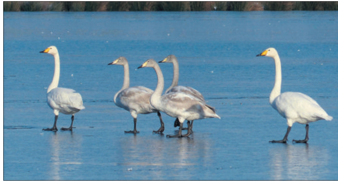
Familie wilde zwaan op het ijs van de Boerenveensche Plassen.