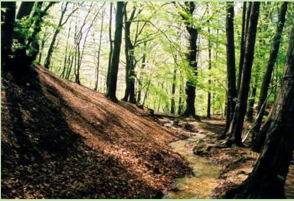
Bronbeek bij de Sint Jansberg

De Sint-Jansberg is een natuurgebied (Natura 2000-gebied) en voormalig landgoed gelegen bij Plasmolen en Milsbeek in Noord-Limburg. Een van de heuvels in het gebied is de Sint-Jansberg die ook Kloosterberg wordt genoemd.