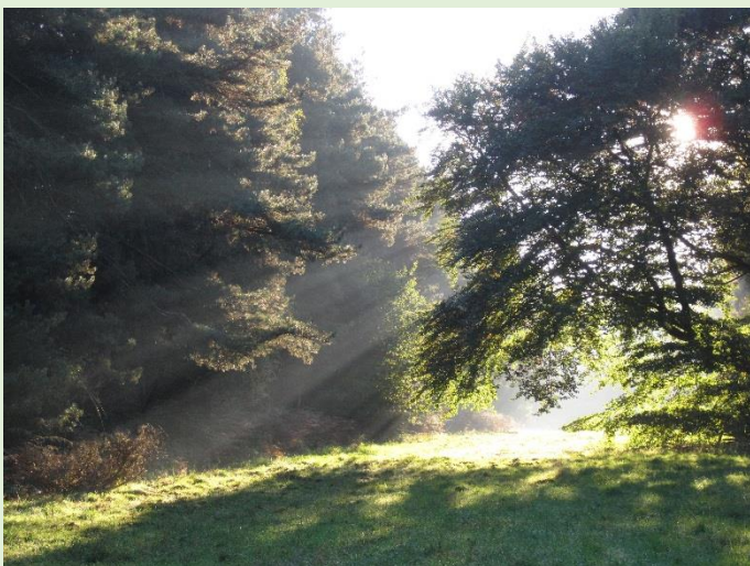
Natuur in het Reichswald, het tegenwoordige Duitse deel van het Ketelwald

Vondsten in het woud wijzen erop dat het woud van groot belang was voor de Romeinen. Deze hebben tijdens hun verblijf - tot ongeveer de 5e eeuw na Chr. - nabij de Waal, wat toentertijd een soort "grens" vormde tussen het land van de Germanen en het Romeinse Rijk, veel sporen achtergelaten. Een van deze sporen is het hedendaags gereconstrueerde aquaduct dat in het gebied tussen Nijmegen, de Heilige Landstichting en Berg en Dal lag. De Romeinen hebben ook grote delen van het bos gekapt als brandstof voor de grote pottenbakkerijen die verspreid over het gebied gevestigd waren. Door bodemvondsten in de voormalige gemeente Groesbeek weten we tegenwoordig dat het gebied ook veel gebruikt werd voor jagen, het ontginnen van bos en het aanbidden van goden.