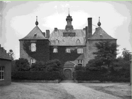
Het kasteel in 1919