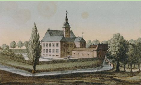
Het kasteel rond 1860

natuurstenen omlijsting (die nog grotendeels aanwezig is) rond de voordeur aangebracht. De ramen zijn in de 19e eeuw vervangen door minder fraaie.