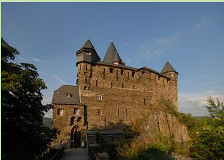
Schildmuur van Burg Stahleck in Bacharach

Een schildmuur is de hoogste en dikste weermuur van een kasteel of burcht, als deze apart van de overige omsluitingsmuren is geplaatst. Een schildmuur heeft als doel het meest kwetsbare deel van een kasteel te beschermen tegen aanvallers. Als een schildmuur in twee richtingen is geplaatst spreekt men ook wel van een hoge mantel of mantelmuur.