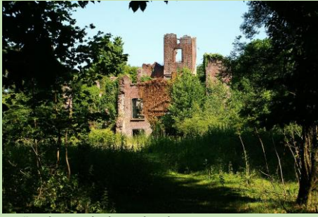
Ruïne kasteel Bleijenbeek