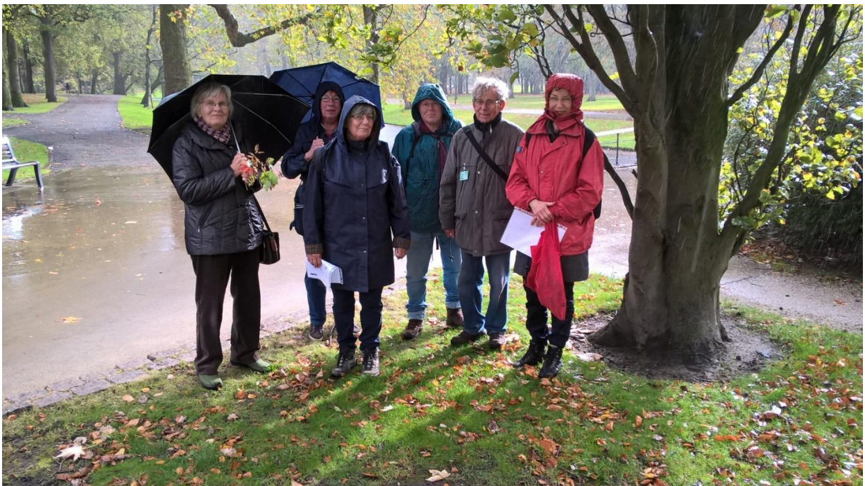
We trotseerden regen en wind en gingen op pad

Het Park is een Rijksmonument, het eerste stadspark van Rotterdam. Het is ontstaan uit de samenvoeging van twee oude buitenplaatsen ten westen van de stad. De parkinrichting is deels van tuin- en landschapsarchitecten vader en zoon Zocher. Er staan momenteel wel 60 boomsoorten in 400 verschillende variëteiten. Vele daarvan zijn exoten. Door de decennia heen zijn nieuwe soorten aangeplant. Genoeg dus om te horen, te zien en te ruiken