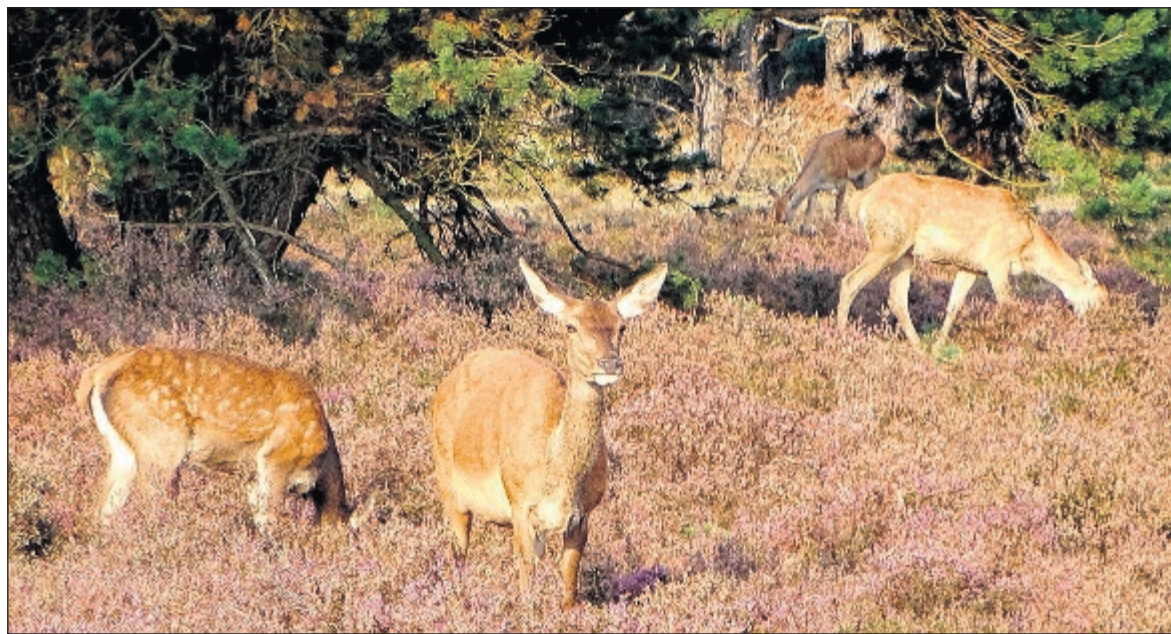
Herten aan de rand van een bos op De Hoge Veluwe.