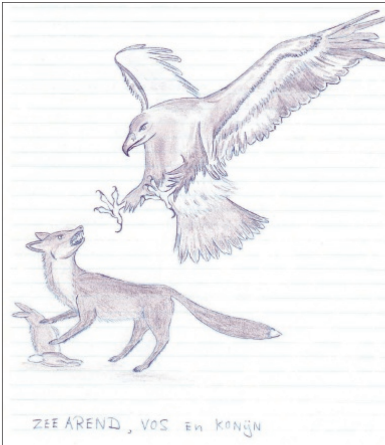
Voedselpiramide: arend, vos en konijn.