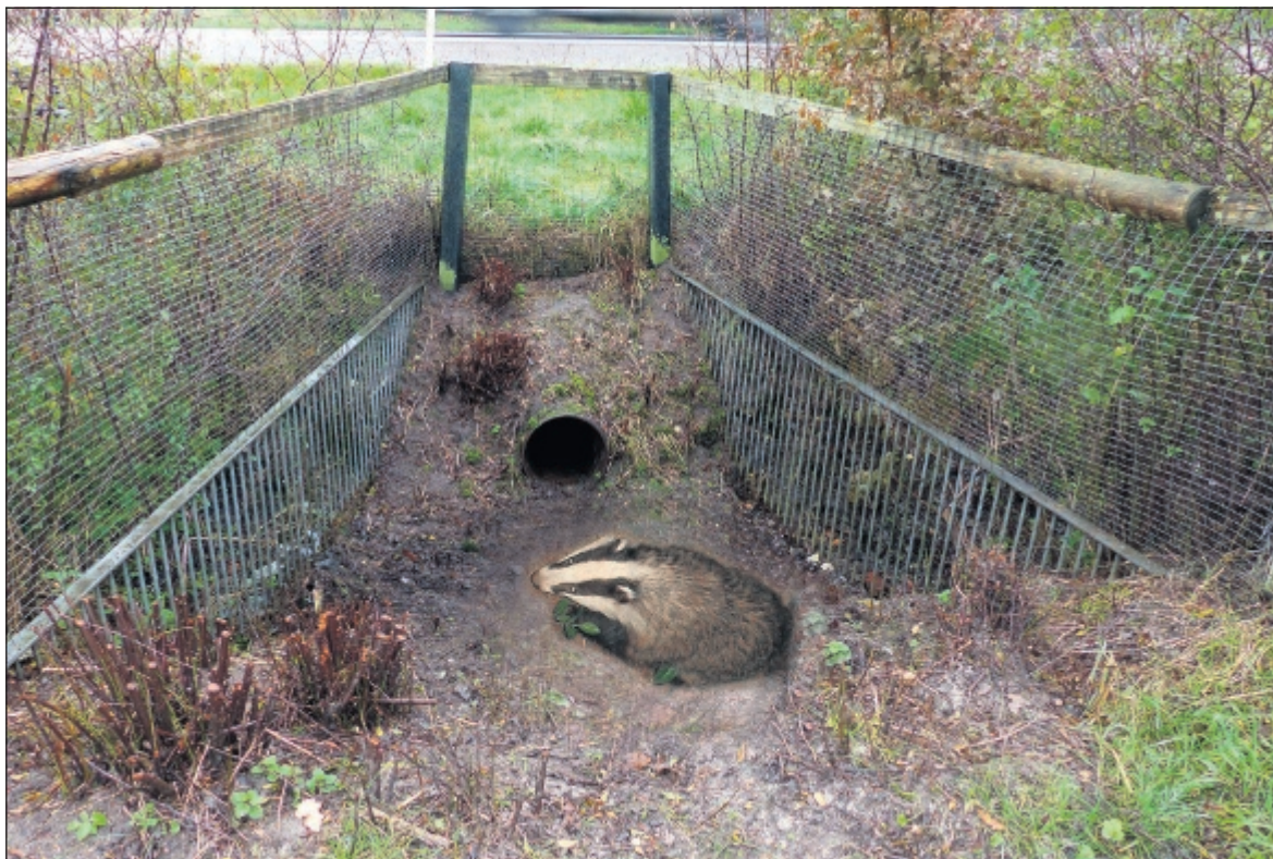
Opslag is verwijderd bij tunnelopeningen onder N48.

Nadat enkele kapitale reebokken in de Hoogeveensevaart waren verdronken, trok ik twintig jaar geleden aan de bel en werd van het kastje naar de muur gestuurd. De Gemeente verwees naar de Provincie, de Provincie naar Provinciale Waterstaat, die vervolgens naar Rijkswaterstaat verwees. Rijkswaterstaat beloofde mijn plan in behandeling te nemen. Je kunt takkenbossen langs de beschoeiing leggen en die met kabels in de wal verankeren. Of je maakt langs de wal een platform met trapje bekleed met dubbeltjesgaas, zodat een dier grip op het natte hout heeft. Ik hoorde niets meer en kreeg de cynische gedachte: ze dronken een glas, deden een plas en alles bleef zoals het was. In de jaren daarna verdronk er af en toe een ree, een das of een kat. Er speelden meer zaken in de natuur en het milieu. En eigenlijk had ik genoeg van het gebel en gemail naar instanties