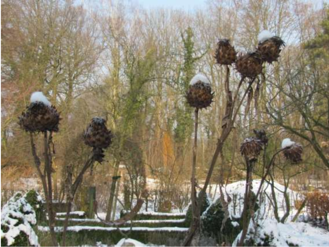
Artisjokken en steenuiltjes in de sneeuw