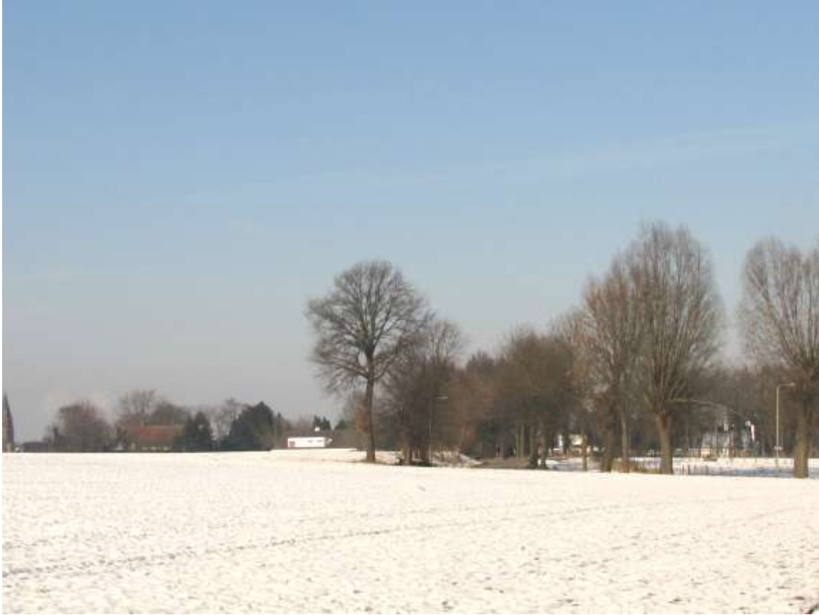
boven >het Heijdenpad: een monumentale structuur! - ook bijzonder: de perenwei < onder