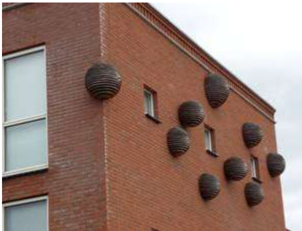
Dit kunstwerk van Martin Borchert (in opdracht van Patrimonium Woonstichting) is gebouwd aan een huis in Dragonder – Oost. Er kunnen gierzwaluwen in nestelen.

Hierin ligt de uitdaging voor de toekomst. De meeste mensen wonen in stedelijk gebied. De eigen leefomgeving is heel belangrijk, het leefbaar houden van de naaste omgeving is dus heel belangrijk. In de tijd van de IVN Milieuwerkgroep, in de jaren 80 en begin 90 moest je alles bevechten. Vooral de overheid was de te bevechten instantie. Daarop hebben we ons toen voornamelijk gericht. Die situatie is geheel veranderd. Nu is de overheid (lees de gemeente Veenendaal) meestal de bondgenoot. De overheid hoef je niet meer om te turnen. Allerlei regels zijn aangescherpt. De gemeente loopt nu voor op het grootste deel van de bevolking.