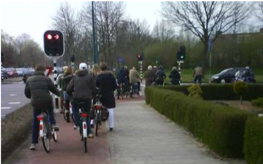
Fietsfile voor het verkeerslicht

Die doorstroommaatregelen kwamen er vanwege vieze vrachtwagens: optrekken van die voertuigen is erg vervuילend. Helaas werkte tot aan de huidige werkzaamheden op de Rondweg West de detectie van deze vrachtwagens slecht waardoor ze eerst toch gingen stoppen en dan in het gezicht van wachtende fietsers hun vieze uitlaatgassen uitbliezen. Op papier is het mogelijk een goede maatregel, maar in Veenendaal werkt het averechts.