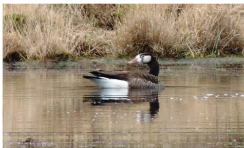
Hybride grauwe gans x grote canadese gans

Daar in de buurt troffen we een hybride aan van een grauwe gans x canadese gans.