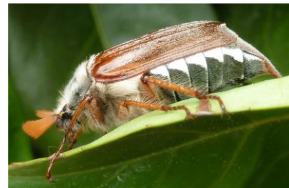
Meikever