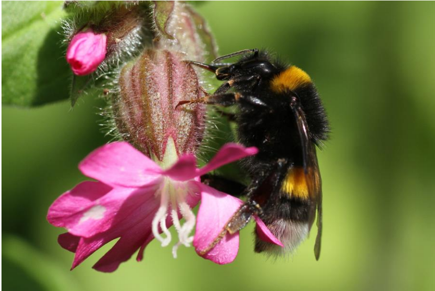
De Aardhommel

Rond maart 'zie je ze weer vliegen' - de hommels. Het zijn grote bijen met een wollige, fleurige beharing. Ze zijn ijverig op zoek naar stuifmeel en nectar. Een klontje stuifmeel zit soms in een speciaal zakje aan hun achterpootjes geplakt. In Nederland komen 29 soorten voor.