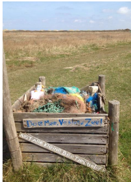
De kwade hoek op Goeree

Wilt u geen nieuwsbrief meer ontvangen stuur dan even een mailtje met vermelding van naam en voornaam naar: ivnrotterdam@gmail.com