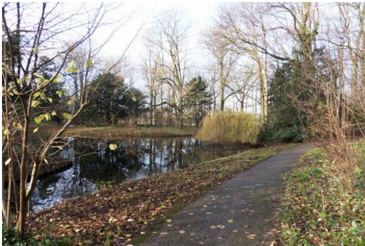
Inventarisatie van de groene gebieden van Haarlemmermeer, januari 2016