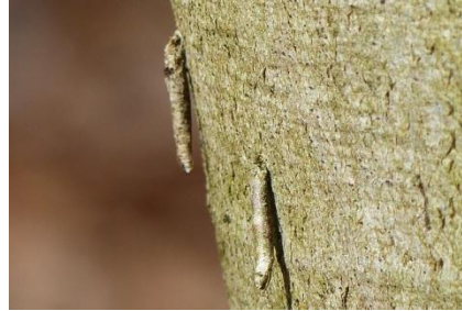
Sigaarzakdrager (Taleporia tubulosa) Beesel 26-05-2016