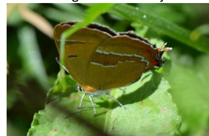
Sleedoornpage (Heteropterus morpheus) Ospel 16-07-2016