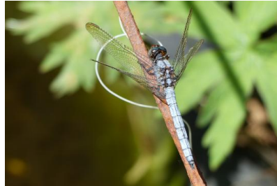
Beekoeverlibel ( Orthetrum coerulescens) Belfeld 16-08-2016