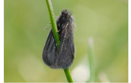
graszakdrager (Epichnopterix plumella)

Buiten ons gebied is in de Ravenvennen de kleine reuzenzakdrager ( Canephora hirsuta ) en of de grote reuzenzakdrager ( Pachyhelia villosella ) gevonden, op het informatiebord en op de heide. In Panningen is een sierlijke zakdrager ( Proutia betulina ) waargenomen op een stalen bordje langs de weg en op afrasteringspalen. Op weer een andere plaats werd een Kleine zandzakdrager ( Dahlica sauteri ) gevonden. Aan de foto's is te zien hoe goed de zakdragers kunnen opgaan in hun omgeving.