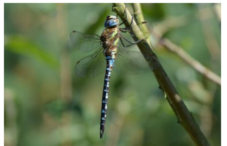
Paardenbijter (Aeshna mixta) Belfeld 24-08-2016