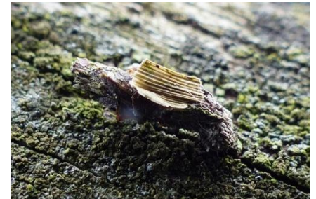
Sierlijke zakdrager (Proutia betulina) Panningen 05-08-2016