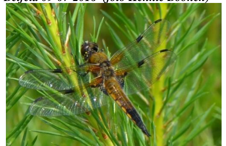
Viervlek (Libellula quadrimaculata) Belfeld 05-06-2016