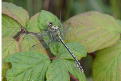
Gaffellibel ( Ophiogomphus cecilia) Swalmen 01-10-2016