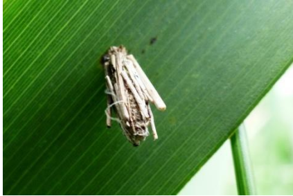
Gewone zakdrager (Psyche caste) Maalbeek 16-08-2016

afrasteringen, bladeren, stalen straatnaamborden en zelfs in stalen prullenbakken. Behalve de gewone zakdragers is ook een graszakdrager ( Epichnopterix plumella ) en de sigaarzakdrager ( Taleporia tubulosa ) waargenomen. Bij de gewone zakdrager zijn de grasstukjes bijna even lang als de cocon. Bij de graszakdrager zijn de grasstukjes in de cocon langer dan de cocon zelf. De sigaarzakdrager komt voornamelijk voor op beukenbomen maar soms ook op afrasteringspalen.