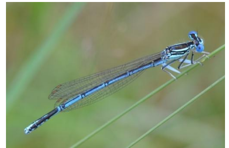
Blauwe breedscheenjuffer ( Platycnemis pennipes) Belfeld 09-07-2016