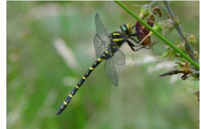
Gewone bronlibel ( Cordulegaster boltonii) Belfeld 09-07-2016