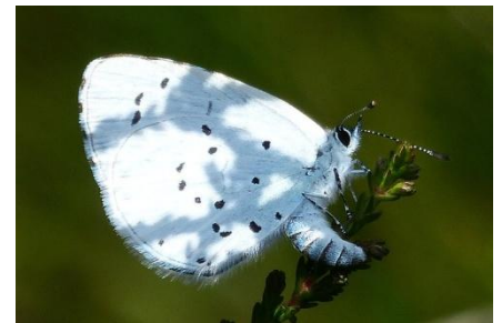
Boomblauwtje (Celastrina argeolus) Belfeld 10-07-2016