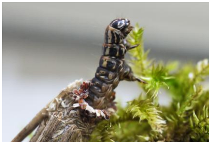
Kleine reuzenzakdrager (Canephora hirsuta)

Buiten ons gebied is in de Ravenvennen de kleine reuzenzakdrager ( Canephora hirsuta ) en of de grote reuzenzakdrager ( Pachyhelia villosella ) gevonden, op het informatiebord en op de heide. In Panningen is een sierlijke zakdrager ( Proutia betulina ) waargenomen op een stalen bordje langs de weg en op afrasteringspalen. Op weer een andere plaats werd een Kleine zandzakdrager ( Dahlica sauteri ) gevonden. Aan de foto's is te zien hoe goed de zakdragers kunnen opgaan in hun omgeving.