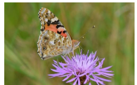
Distelvlinder (Vanessa cardui) Tegelen 24-07-2016