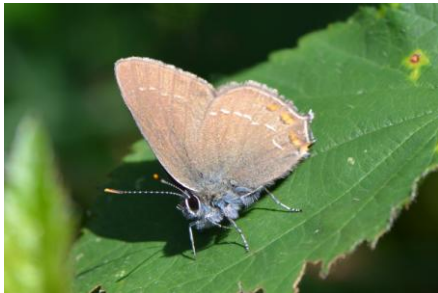
Bruine eikenpage (Satyrium ilicis) Broekhuizen 02-07-2016

een dode boom kwamen. Ook komen er bijzondere planten, zoals orchideeën, voor in het gebied. In de middag zijn we naar Ottersum gegaan waar we langs de Niers gewandeld hebben. Er vlogen zeer veel Weidebeekjuffers en Blauwe breedscheenjuffers.