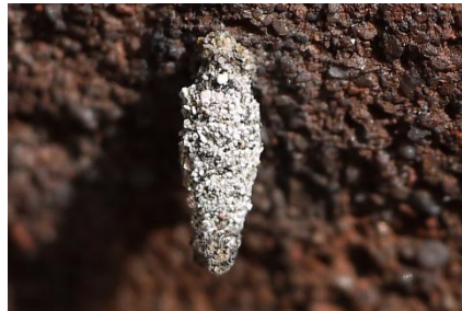
Kleine zandzakdrager (Dahlica sauteri)