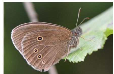
Koevinkje (Aphantopus hyperantus) Belfeld 03-07-2016