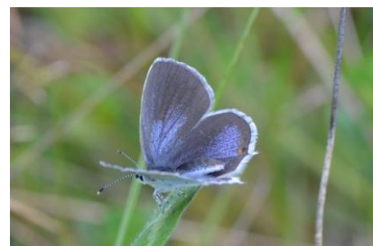
Staatblauwtje (Cupido argiades) Tegelen 20-08-2016

Net als vorig jaar, zijn ook dit jaar de staarblauwtjes weer waargenomen door onze leden binnen ons gebied. Dit keer op 2 verschillende plaatsen. Echter in minder aantallen. Hopelijk blijft de vlinder voorkomen in ons gebied.