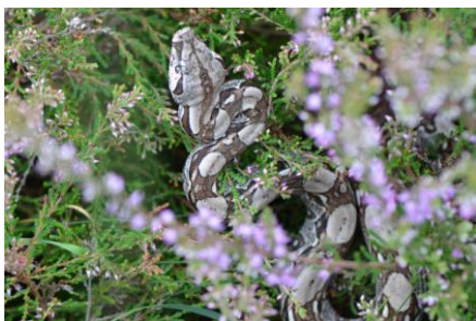
Columbia red tail boa constrictor Venlo 13-08-2016