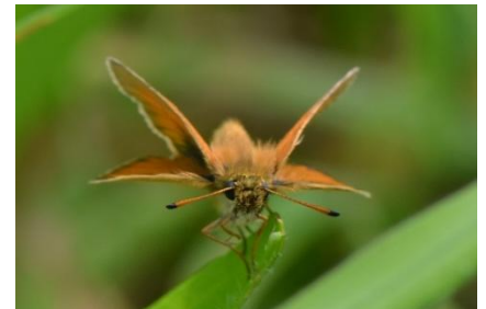
Zwartsprietdikkopje ( Thymelicus lincola) Belfeld 09-07-2016