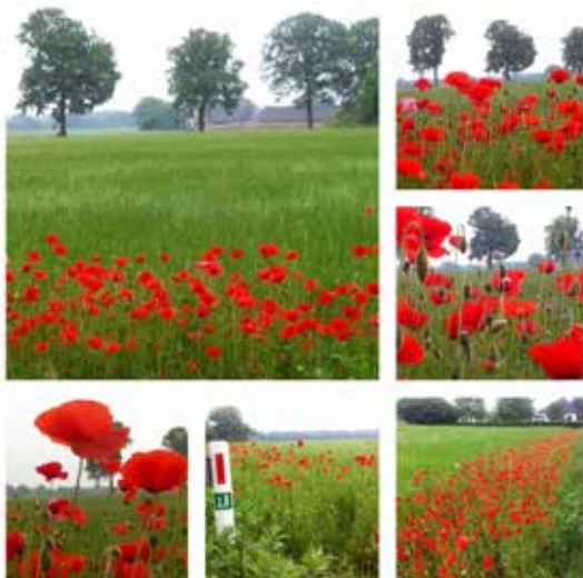
Foto Klaprozen Barchemseweg