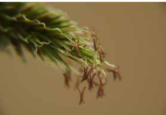
Foto bloeiend gras

Een van de eerste soorten grassen die bloeien in het voorjaar is de grote vossenstaart. Het bloeit met een zachte aarpluim 1cm dik en tot 10 cm lang. Het is een goed voedergras. In Nederland is het een algemeen voorkomend grassoort. Hier zie je de bloei met rijpe helmknoppen. Eerst verschijnen vrouwelijke bloemen, room wit. Later komen de mannelijke bloemen in bloei.