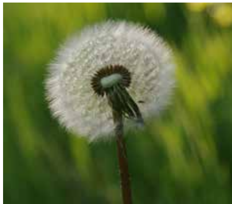
Foto uitgebloeide paardenbloem

Mooi dat de natuur opfleurt door groei en bloei van planten.