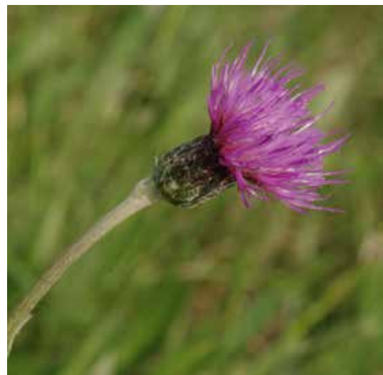
Foto Spaanse Ruiter

Spaanse ruiter. Beschermd plant! Spaanse ruiter behoort tot de composietenfamilie. In tegenstelling tot distels heeft de plant geen stekels. Groeit op blauwgraslanden met een voedselarme zure bodem. De naam is vreemd. In Spanje tref je de plant niet aan. Hier zeldzaam.