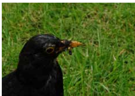
Foto Merel met hapje

Nu had ik dit weer in de tuin. Ik denk dat het een sluipwesp is. Mooie antennes heeft deze. Even na het op de foto zetten ontdekte de merel in de tuin een lekker hapje!! Eten en gegeten worden. Weg sluipwesp. De merel deed er nog een paar happen bij in de tuin met insecten. Vloog daarna met volle bek weg.