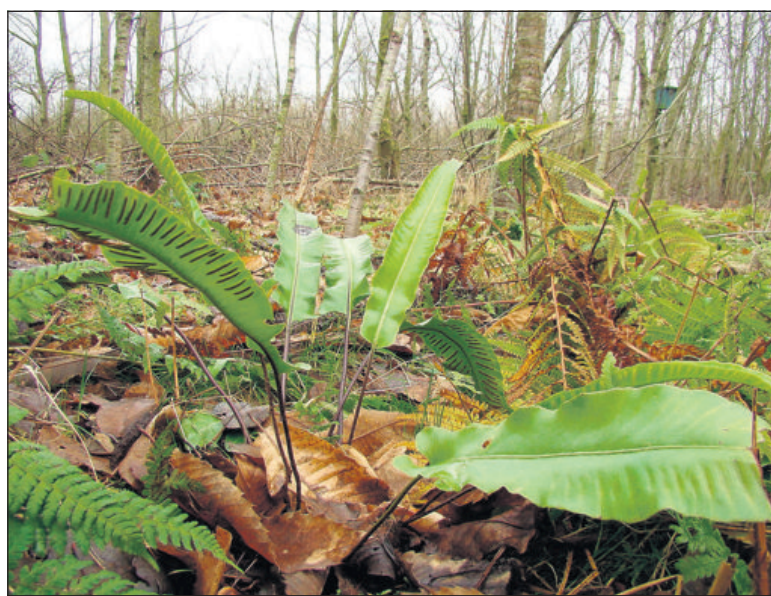
Tongvaren in het jonge bos bij Linde.